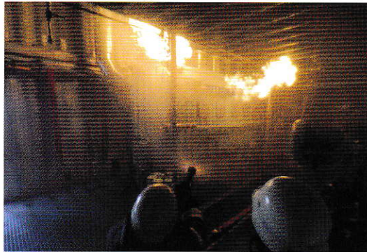
„Shield“ eines Gasbrandes an einer Schiffsmaschine

Bei der GSSO geht es eben nicht nur um die Ausstellung von Zertifikaten, sondern um die Fähigkeit der Teilnehmer im Notfall all ihre Kenntnisse für deren Bewältigung einzusetzen. Das Hauptkredo unserer Instruktooren und Dozenten ist der Leitspruch: „Nur wenn alle Kenntnisse,